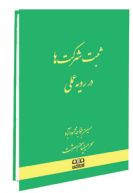
ثبت شرکت‌ها در رویه عملی