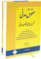
شرح جامع قانون مدنی