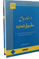
درسینامه جامع حقوق تجارت