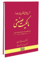
شرح جامع قانون حمایت از مالکیت صنعتی