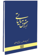
کلیات حقوق مالیاتی