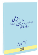
آشنایی با قوانین و مقررات سازمان تأمین اجتماعی در حوزه کارفرمایی