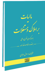
مالیات بر املاک و مستغلات با رویکردی نظری و عملی