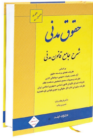
شرح جامع قانون مدنی