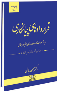
قراردادهای پیمانکاری در پرتو مقررات کاربردی سازمان تأمین اجتماعی