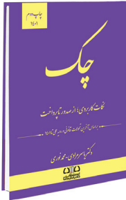
چک نکات کاربردی از صدور تا پرداخت