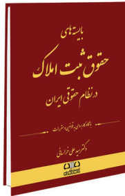
بایسته‌های حقوق ثبت املاک در نظام حقوقی ایران