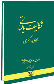
تکالیف مالیاتی وکلا دادگستری