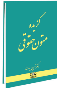
گزیده متون حقوقی