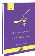
چک؛ نکات کاربردی از صدور تا پرداخت