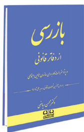
بازرسی از دفاتر قانونی