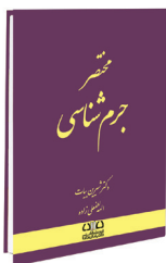
مختصر جرم شناسی